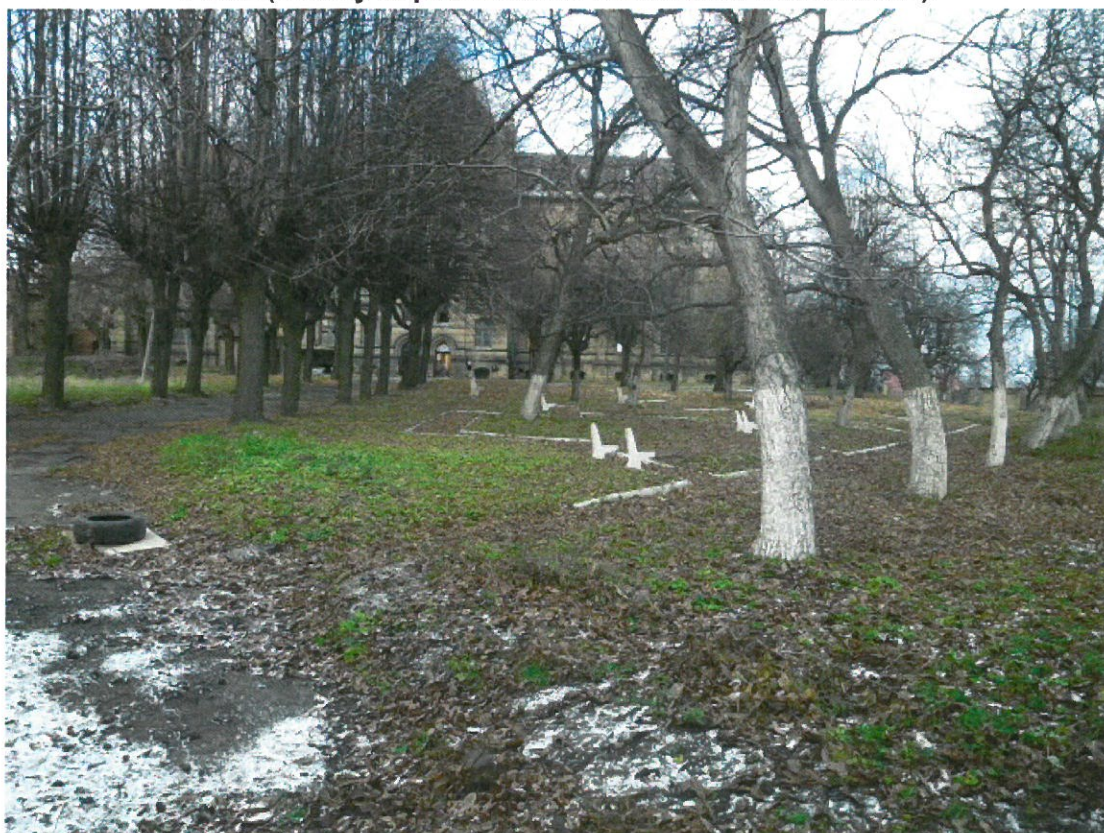
Park przy pałacu.