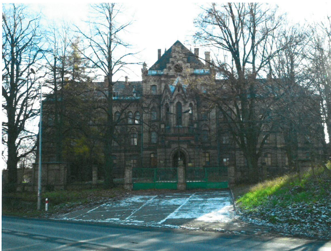
Pałac (Dawny Szpital Zakonu Kawalerów Maltańskich).