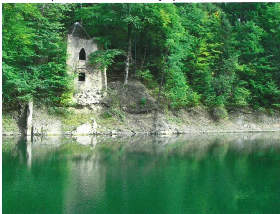
Jeziorko Daisy ( http://gorkipagorki.blogspot.com/2012/08/jeziorko-daisy.html ).