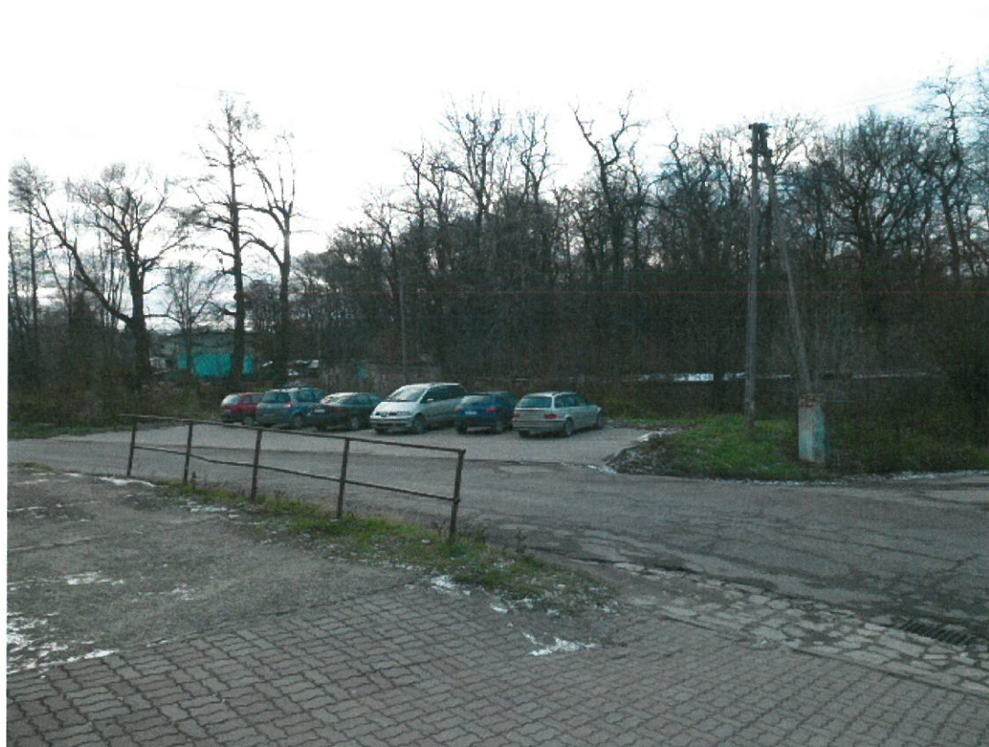
Parking przy szkole podstawowej w głębi park.