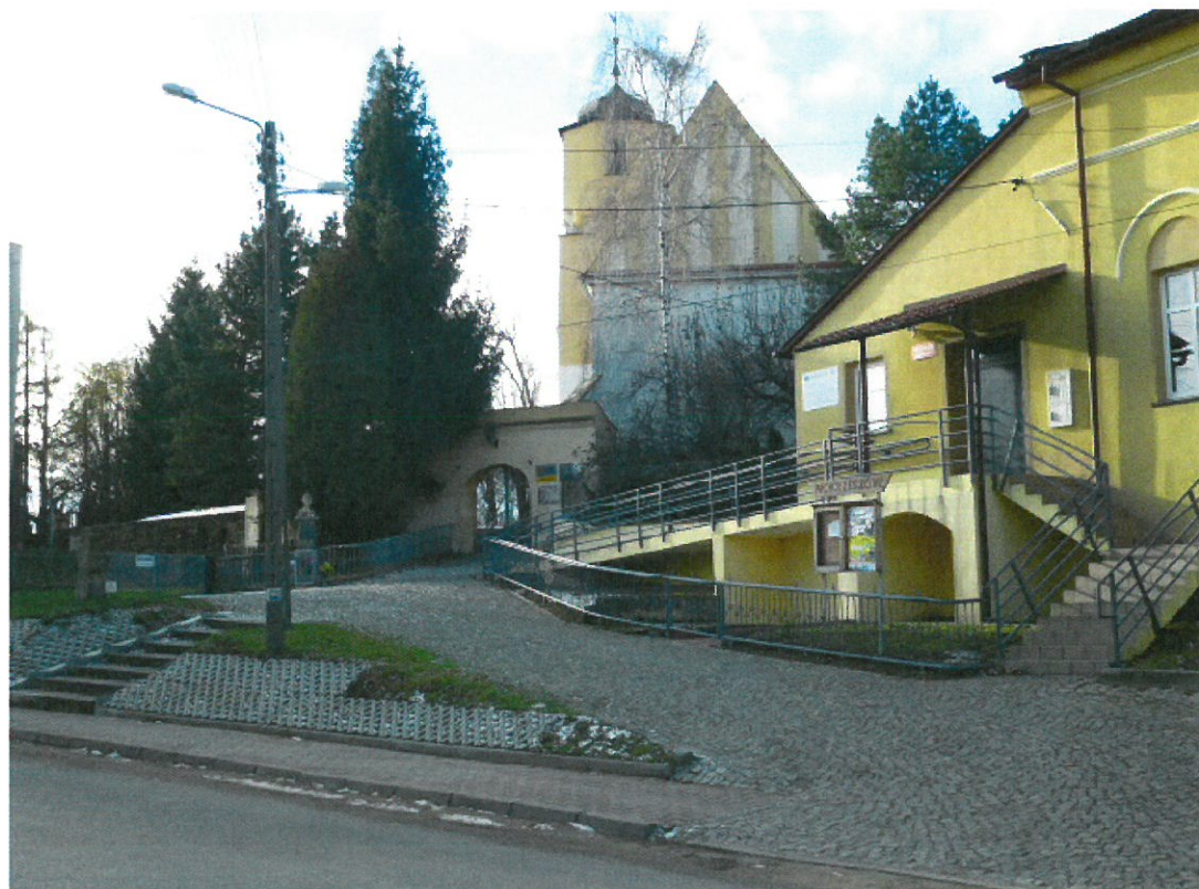
Plac przed świetlicą wiejską i kościołem.