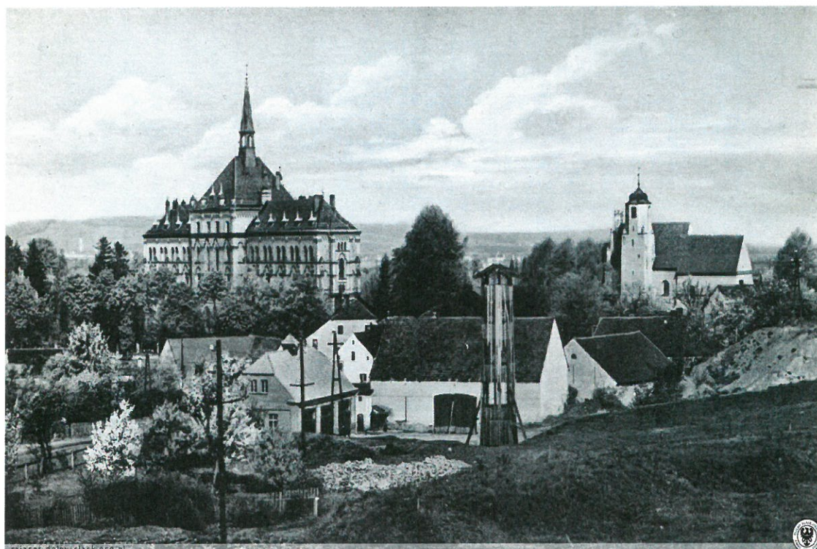
Widok na centralną część wioski lata 30 XX w..