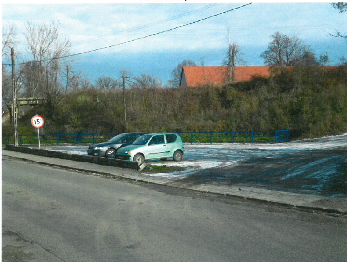
Parking przy świetlicy wiejskiej.