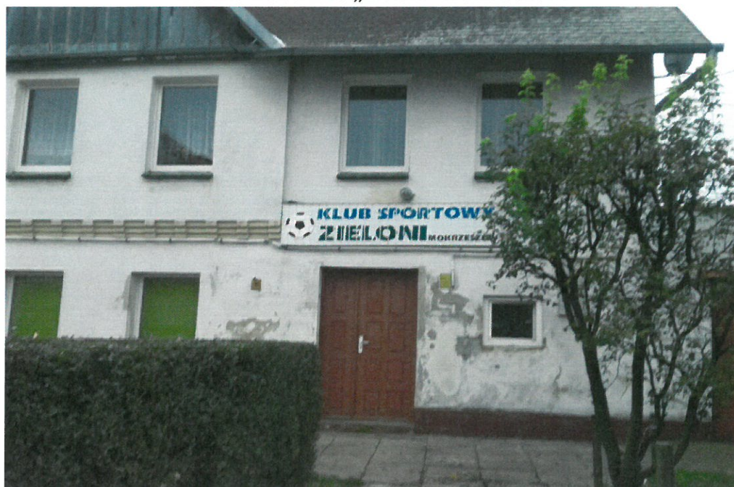
Siedziba klubu LZS „Zieloni” Mokrzeszów.