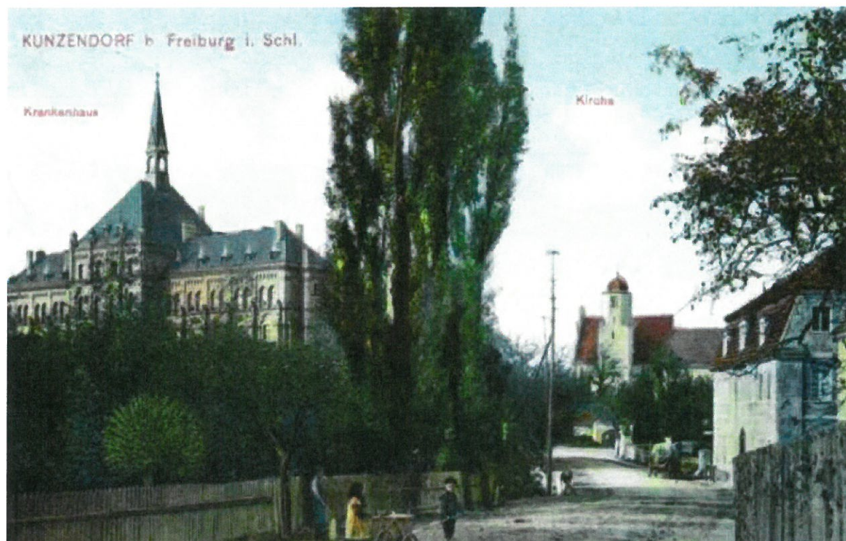
Centralna część wioski – pocz. XX w..