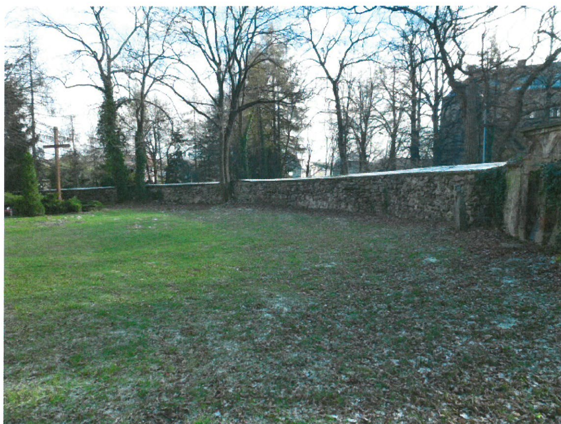
Mur okalający plac przy kościele.