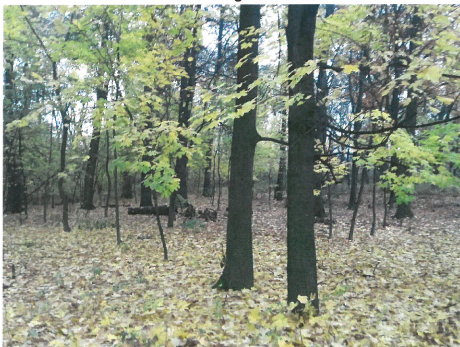
Park w centralnej części wioski.