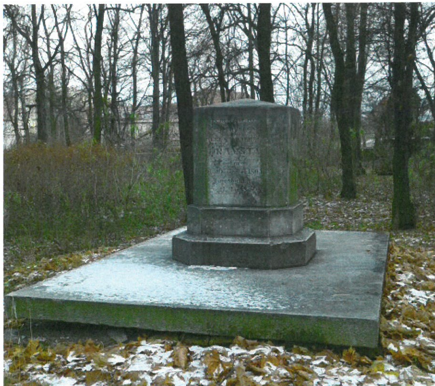
Pomnik w parku.