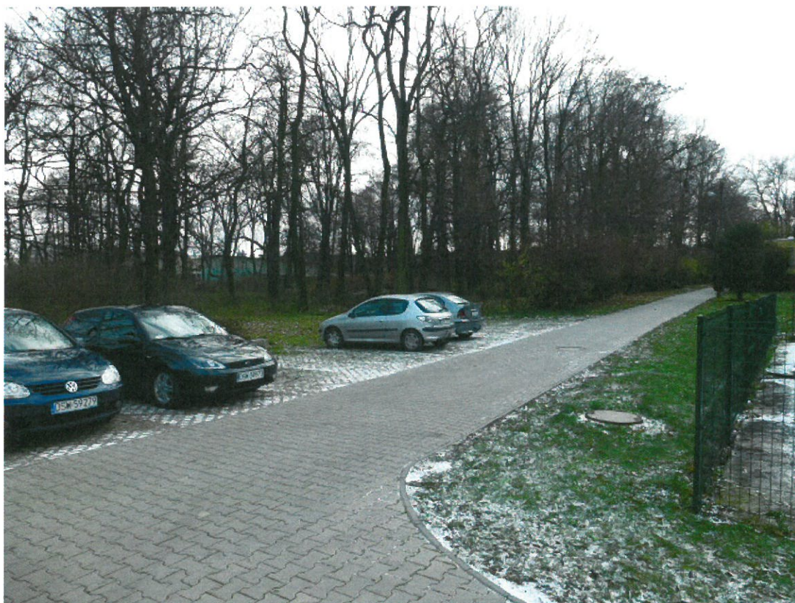
Park – widok od strony terenu Zespołu Szkół Centrum Kształcenia Rolniczego.