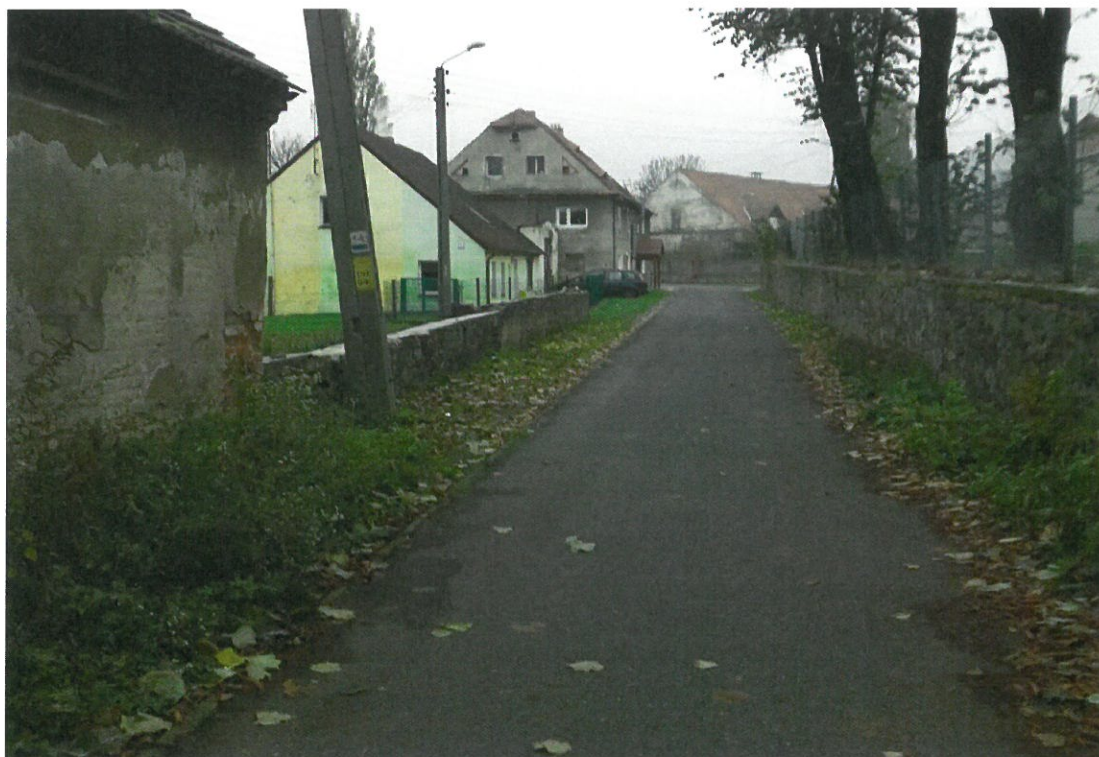
Jedna z bocznych uliczek Mokrzeszowa.