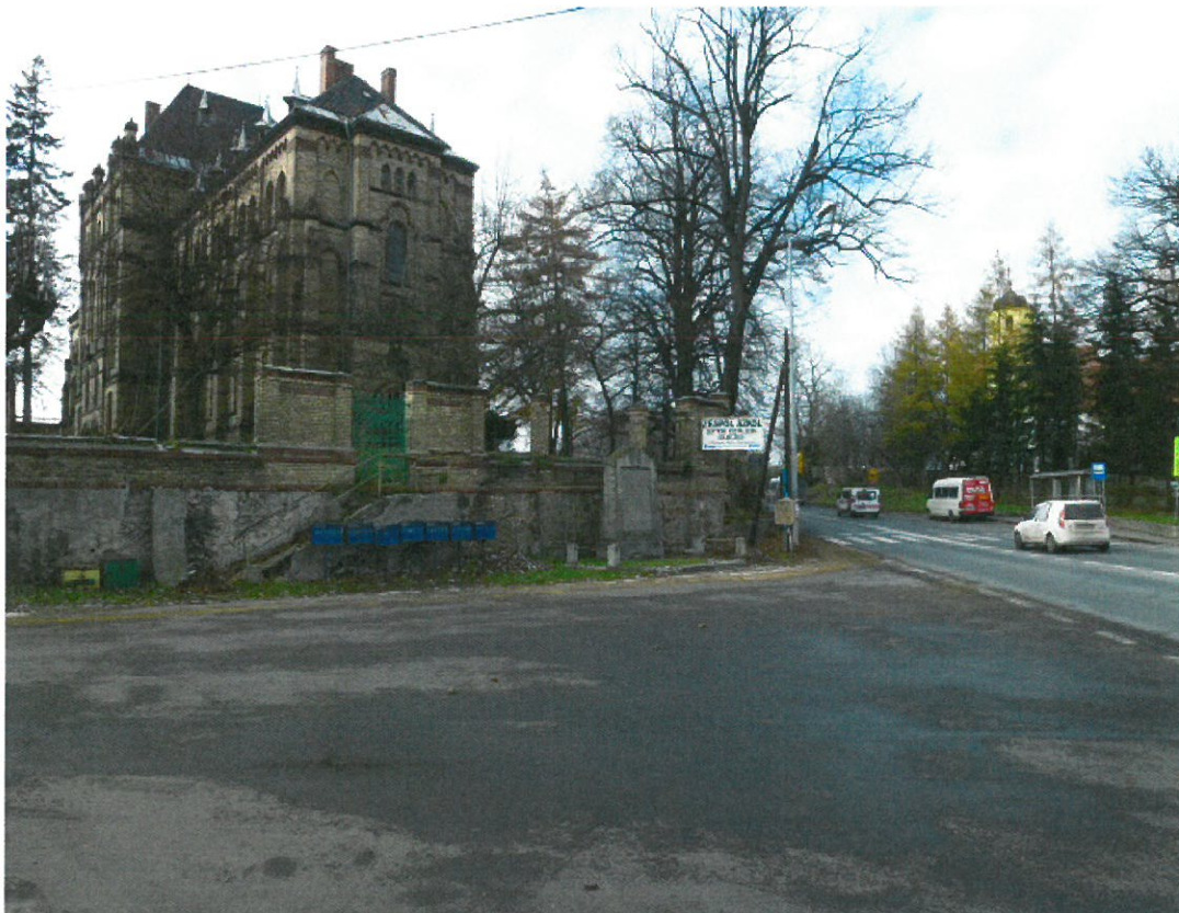
Plac w centrum wioski.