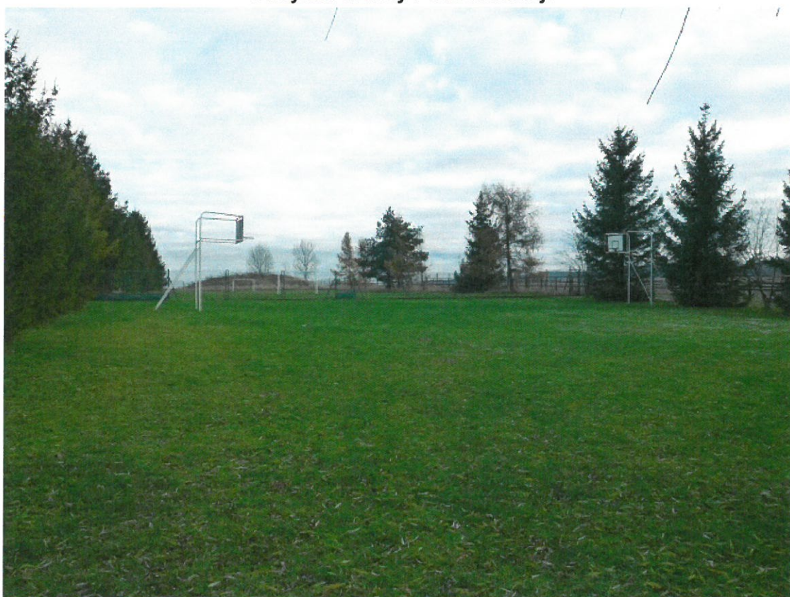
Boisko przy szkole podstawowej.