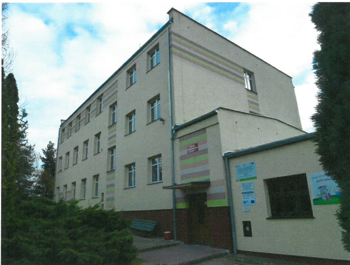
Budynek Szkoły Podstawowej.