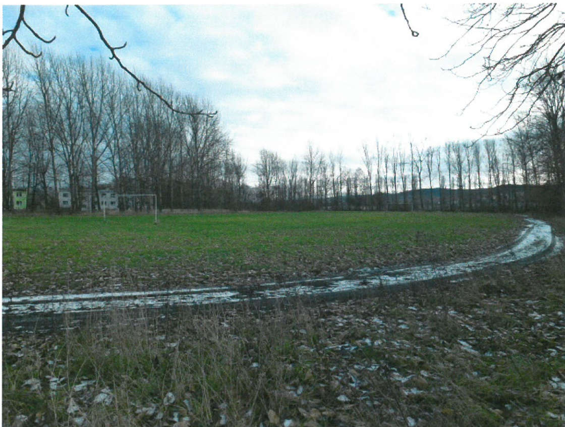
Opuszczone boisko w centralnej części Mokrzeszowa.