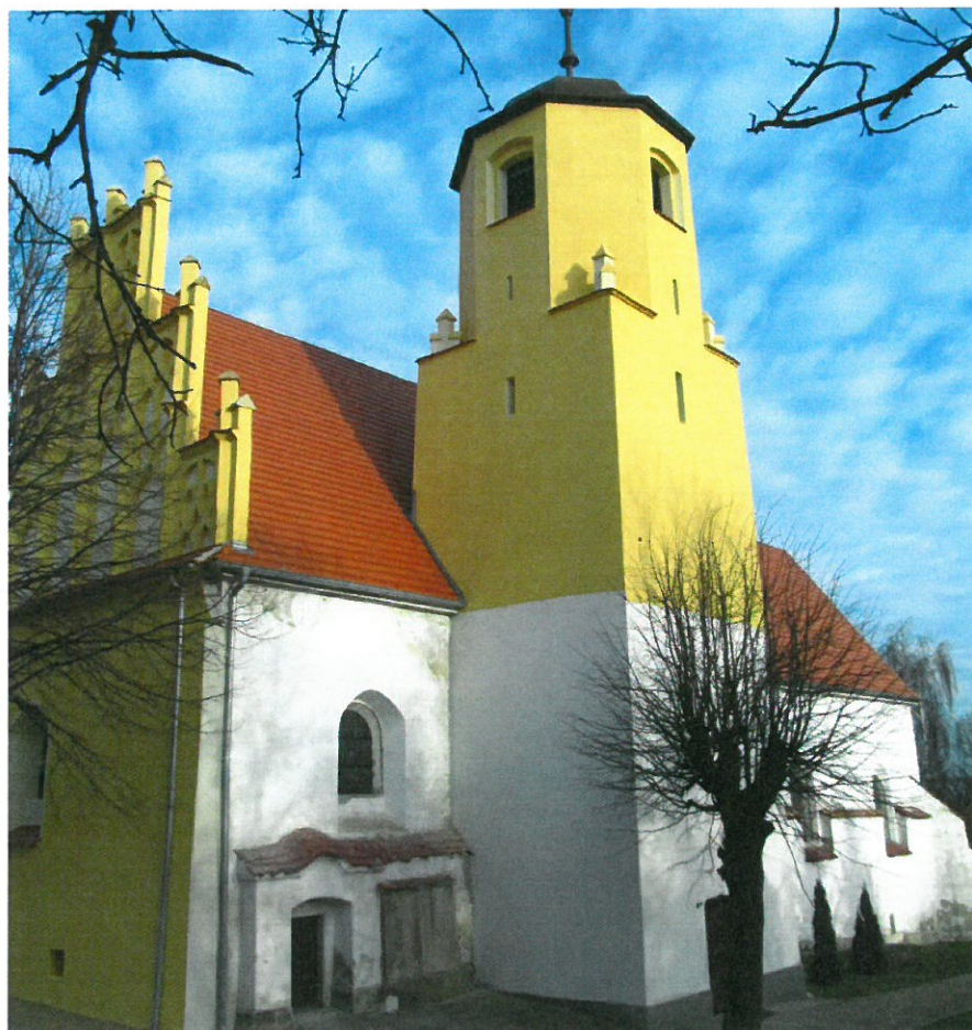
Kościół p.w. Św. Jadwigi.