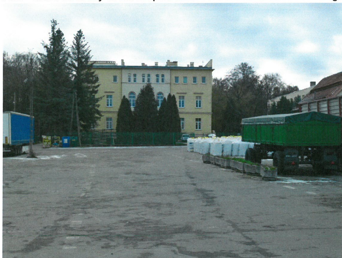
Budynek główny Zespołu Szkół Centrum Kształcenia Rolniczego.