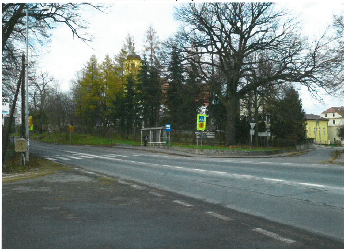
Plac w centrum wioski.