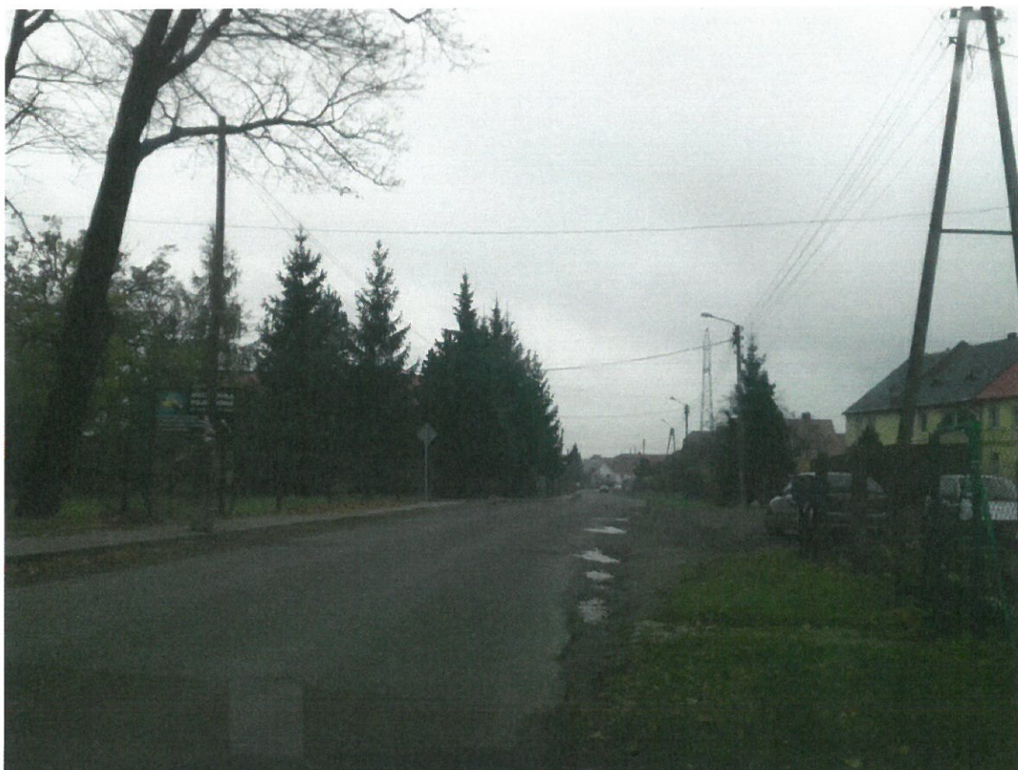
Widok na dolną część wioski.