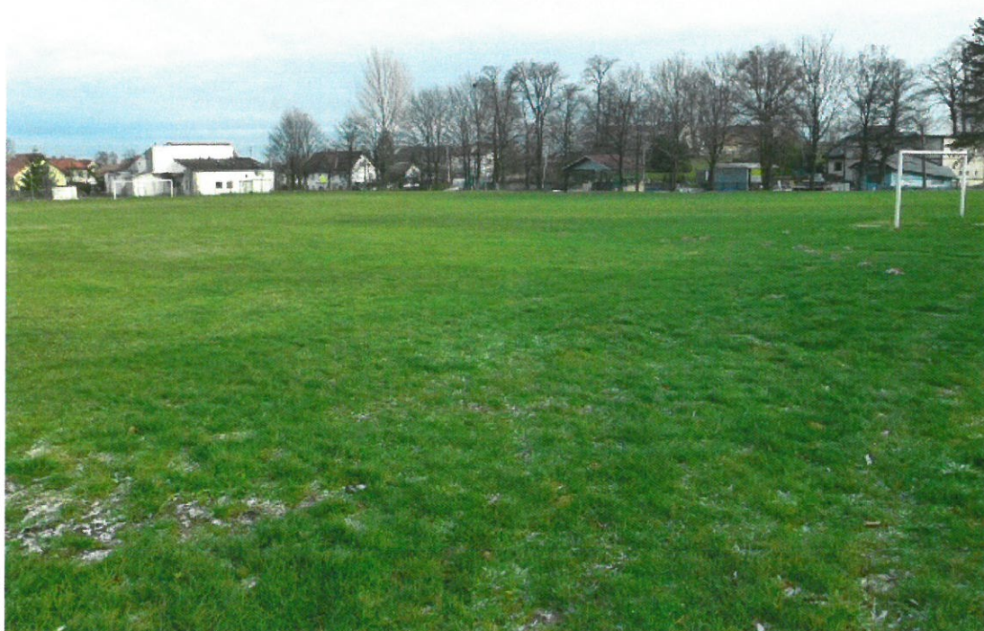
Boisko klubu LZS „Zieloni” Mokrzeszów.