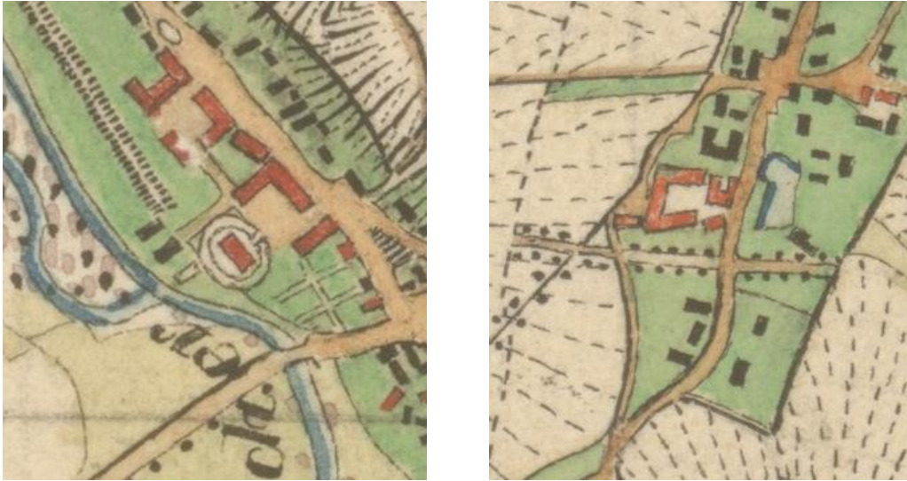
Ilustracja nr 4 Założenia w Wilkowie i Gogołowie na mapie Preußische Urmessstischblätter

W XVI stuleciu ukształtowała się struktura przestrzenna folwarku feudalno-pańszczyźnianego, w skład którego wchodziła siedziba właściciela tj. dwór lub pałac, oraz zespół zabudowy folwarcznej. Późnogotyckie i renesansowe dwory były przebudowywane i rozbudowywane, ich wygląd ulegał przeobrażeniom zgodnie z obowiązującymi aktualnie trendami. W dobie baroku w otoczeniu rezydencji pojawiają się parki i ogrody. Najlepszym i najpełniej zachowanym przykładem z tego okresu jest zespół pałacowo-parkowy z folwarkiem w Krzyżowej. W XVII stuleciu wniesiono także pałac w Komorowie i dwór w Grodziszczu, barokizacji uległy w tym czasie dwór w Gogołowie, pałac w Grodziszczu i pałac w Witoszowie Dolnym. W kolejnym wieku wzniesiono dwór w Bojanicach, pałac w Bolescinie, dwory w Lutonii Dolnej, pałac i dwór w Mokrzeszowie czy dwór w Wieruszowie. W końcu XIX stulecia pojawiła się nowa forma rezydencji, w tym czasie upowszechniły się wille, które wielkością i formą architektoniczną nie ustępowały pałacom. Ich właścicielami byli m.in. majątni fabrykanci. Na terenie gminy Świdnica obiektami takimi są willa dyrektora cukrowni w Pszennie oraz willa podmiejska w Bystrzycy Górnej.