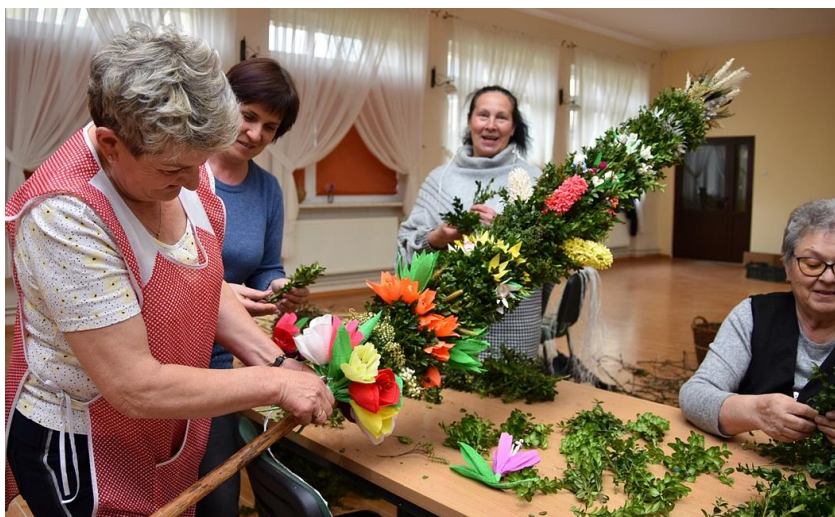
Ilustracja nr 21 Panie z KGW w Lutomi Dolnej przy pracy

Panie z Koła Gospodyń Wiejskich w Lutomi Dolnej jeżdżą na przeglądy i biorą udział w konkursie na „Najpiękniejszą Palmę i Pisanek Wielkanocną” w Jeleniej Górze, gdzie co roku odbywa się „Prezentacja Tradycyjnych Stołów Wielkanocnych, Palm i Pisanek”. Również Świdnicki Ośrodek Kultury organizuje konkursy na palmy wielkanocne.