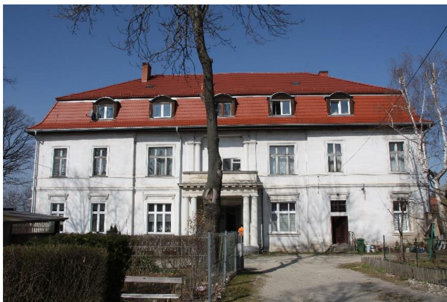
Ilustracja nr 6 Pałac w Bolescinie, widok od południa

Bojanice , dwór. Wzniesiony w k. XIX w. w zespole dworsko-folwarcznym należącym do rodu von Websky. Obiekt pełnił głównie funkcję siedziby zarządcy. Założony na planie wydłużonego prostokąta, dwukondygnacyjny, nakryty dachem mansardowym. Murowany, otynkowany, elewacja zachodnia. docieplona i otynkowana, z pokryciem dachowym z dachówki ceramicznej karpiówki w kolorze ceglastym układanej podwójnie w koronkę. Elewacja wsch. (frontowa) w przyziemiu 7-osiowa, wyżej 6-osiowa, z płytkim ryzalitem w przyziemiu 3-osiowym, wyżej 2-osiowym, zwieńczonym trójkątnym szczytem nakrytym dachem dwuspadowym, w szczycie oculus. Dekoracja architektoniczna w postaci gzymsów międzykondygnacyjnych i koronujących, profilowanych obramień, narożnych lizen i plakiet podokiennych.