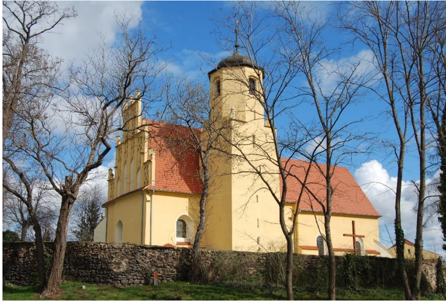
Ilustracja nr 15 Kościół w Mokreszowie, widok od południa