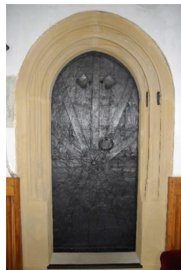
Ilustracja nr 19 Grodziszcz, kościół pw. św. Anny, portal otworu wejściowego zakrystii z I poł. XVI w.

Poza obiektami sakralnymi do rejestru zabytków wpisane są wyłącznie dwa zespoły zabytków ruchomych, będących wyposażeniem pałaców w Krzyżowej oraz Wiśniowej. Elementami wystroju zewnętrznego i wewnętrznego rezydencji w Krzyżowej figurującymi w rejestrze: barokowy portal wejścia głównego, balustrada neobarokowa schodów głównych; sztukaterie neorokokowe hallu; sztukaterie neorokokowe w sali na parterze; kominek neobarokowy w