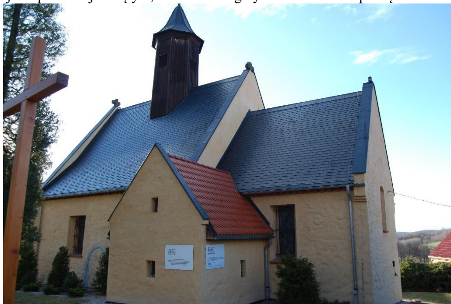
Ilustracja nr 14 Kościół w Modliszowie, widok od południa

Modliszów , kościół filialny pw. św. Bartłomieja. Wzmiankowany po raz pierwszy w 1318 r. W II poł. XIV w. w miejscu pierwszej świątyni, wzniesiono gotycki kościół. W początku XVI w. kościół