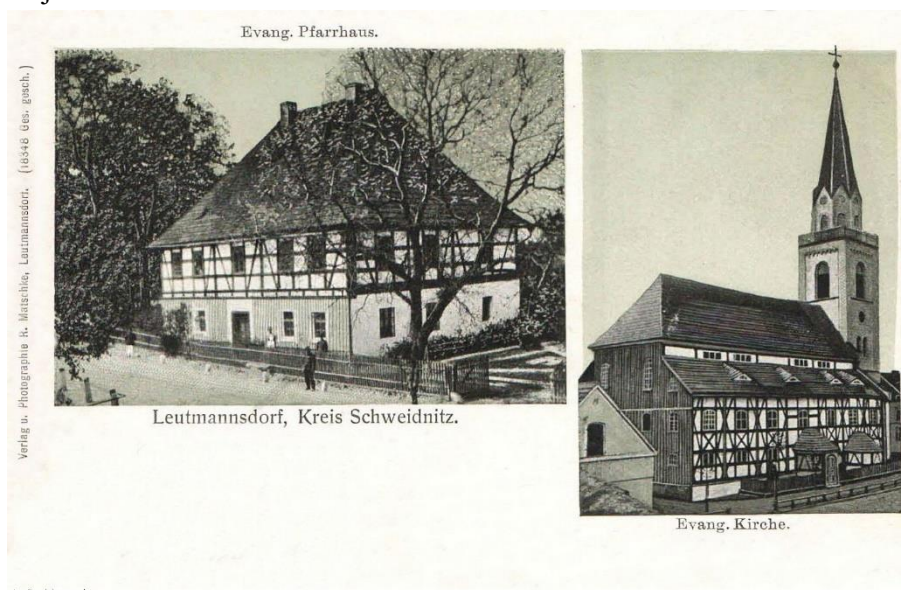
Ilustracja nr 12 Kościół i plebania ewangelicka na pocztówce

stuleciu świątynie takie wzniesiono w Grodziszczu i Lutonii. Niestety do naszych czasów obiekty te nie zachowały się, a jedynym ich reliktem jest murowana wieża z 1857 r., obecnie stanowiąca jeden z wyróżników krajobrazu Lutonii.