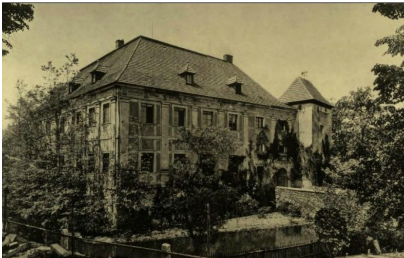
Ilustracja nr 5 Dwór w Pankowie

W XVI stuleciu ukształtowała się struktura przestrzenna folwarku feudalno-pańszczyźnianego, w skład którego wchodziła siedziba właściciela tj. dwór lub pałac, oraz zespół zabudowy folwarcznej. Późnogotyckie i renesansowe dwory były przebudowywane i rozbudowywane, ich wygląd ulegał przeobrażeniom zgodnie z obowiązującymi aktualnie trendami. W dobie baroku w otoczeniu rezydencji pojawiają się parki i ogrody. Najlepszym i najpełniej zachowanym przykładem z tego okresu jest zespół pałacowo-parkowy z folwarkiem w Krzyżowej. W XVII stuleciu wniesiono także pałac w Komorowie i dwór w Grodziszczu, barokizacji uległy w tym czasie dwór w Gogołowie, pałac w Grodziszczu i pałac w Witoszowie Dolnym. W kolejnym wieku wzniesiono dwór w Bojanicach, pałac w Bolescinie, dwory w Lutonii Dolnej, pałac i dwór w Mokrzeszowie czy dwór w Wieruszowie. W końcu XIX stulecia pojawiła się nowa forma rezydencji, w tym czasie upowszechniły się wille, które wielkością i formą architektoniczną nie ustępowały pałacom. Ich właścicielami byli m.in. majątni fabrykanci. Na terenie gminy Świdnica obiektami takimi są willa dyrektora cukrowni w Pszennie oraz willa podmiejska w Bystrzycy Górnej.