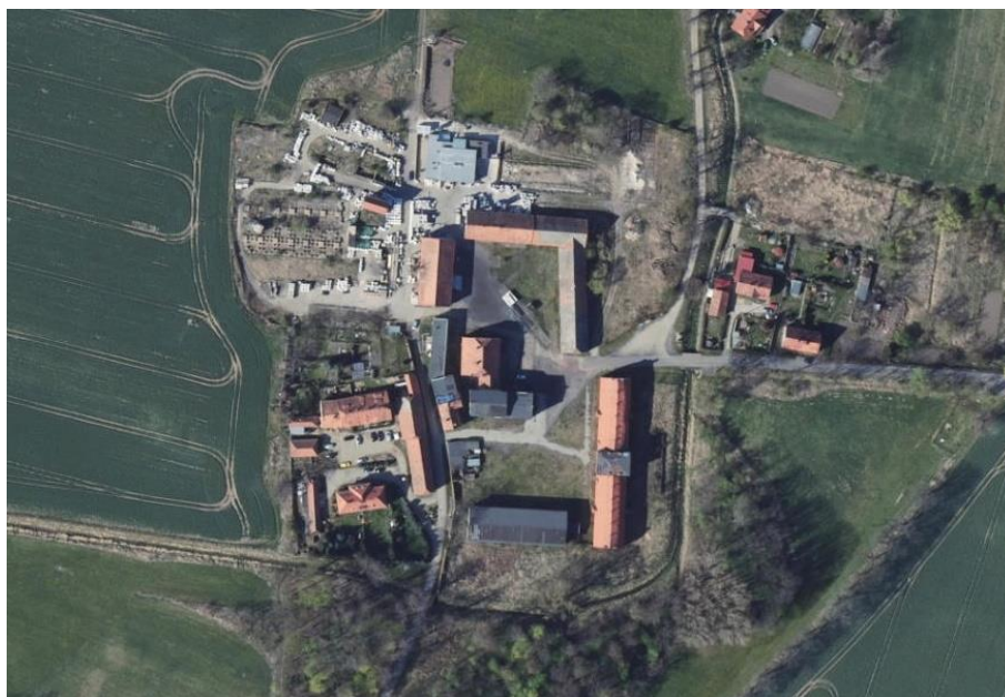
Ilustracja nr 17 Folwark w zespole pałacowo-parkowym z folwarkiem w Komorowie

spośród których część w XIX stuleciu stała się kurortami, istotnym elementem zabudowy są również obiekty hotelowe i pensjonaty.