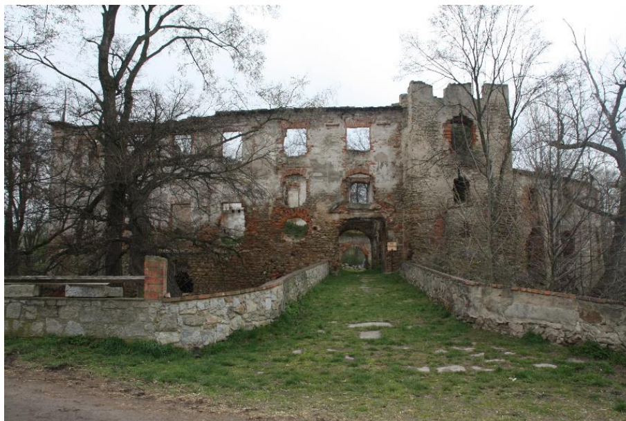
Ilustracja nr 10 Dwór w Pankowie, widok od wschodu

Panków , dwór. Siedziba rycerska o charakterze obronnym wzniesiona została w II poł. XV w. przez ród von Bock. W kolejnym stuleciu przebudowano i rozbudowano go w stylu renesansowym. Następna przebudowa miała miejsce w 1699 r., kiedy to nadano mu charakter barokowy. Ruiny dworu usytuowane są na wyspie, z trzech stron otoczony fosą, przez którą od strony wsch. przerzucony jest kamienny most. Pomimo kilkakrotnych przebudów nadal czytelny jest podział pomiędzy częścią płn. (starszą) i płd. nowszą, które oddziela nieregularny dziedziniec. Murowany z kamienia i cegły, otynkowany. Część płd. 3-kondygnacyjna, pierwotnie nakryta dachem mansardowym. Elewacja wsch. (frontowa) 6-osiowa, symetryczna. W narożniku płn.-wsch. znajduje się brama przejazdowa, a także 3-kondygnacyjna ryzalitowana wieża, do której od płn. przylega starsza część dworu. Wejście od strony zach. do wieży prowadzi poprzez odkuty w granicie portal zwieńczony łukiem dwuramiennym. Otwory okienne duże, prostokątne. Tynki zachowane w stanie szczątkowym, podobnie jak dekoracja architektoniczna. Część płn. dworu na planie półkolistym, dwukondygnacyjna.