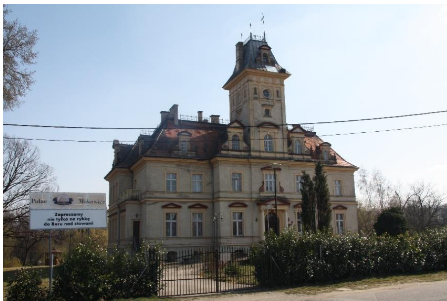
Ilustracja nr 9 Pałac w Makowicach, widok od zachodu

Makowice , pałac. Wybudowany w 1879 r. w dobrach rodu von Websky, być może z wykorzystaniem obiektu wcześniejszego. Wzniesiony w stylu francuskiego neorenesansu w formie dwukondygnacyjnego prostopadłościanu z ryzalitami na osi, przykryty dachem czterospadowym ze świetlikiem nad częścią centralną, o wolutowych lukarnach w połaciach dachowych. Murowany z cegły, otynkowany, z pokryciem dachowym z dachówki ceramicznej karpiówki ułożonej w łuskę. Elewacja frontowa od zach. 7-osiowa, z 3-osiowym ryzalitem, nad którym czworoboczna, trójkondygnacyjna wieża nakryta dachem czterospadowym pobitym blachą układaną na rąbek stojący z lukarną w połaci zach. Główne wejście w osi środkowej, otwór poprzedzony kolumnowym portalem zwieńczonym belkowaniem i tympanonem. Elewacja wsch. komponowana analogicznie. Ryzalit po stronie wsch. zamknięty 3-osiową, dwukondygnacyjną wolutową facjatą, flankowany cylindrycznymi wieżyczkami. Poprzedza go portyk kolumnowy zwieńczony tarasem dostępnym z piętra oraz taras zakończony półkoliście z jednobiegowymi schodami po bokach. W elewacji półd. balkony po bokach ryzalitu, w elewacji półn. jeden balkon. profilowanych obramieniach zamkniętych trójkątnymi i półkolistymi naczółkami. Powyżej otwory o obramieniach z uszakami i kluczem.