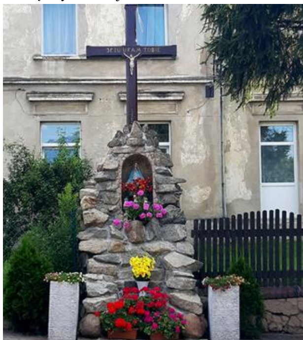
Ilustracja nr 20 Krzyż z Opoczki

Strukturę społeczną mieszkańców wsi tworzą osoby wywodzące się z repatriantów z dawnych Kresów II RP, z Polski Centralnej, Pogórza Karpackiego. Na terenie gminy Świdnica w zasadzie nie ma mieszkańców wywodzących się z rodzin autochtonicznych, więc nie zidentyfikowano we wsi zjawisk i tradycji charakterystycznych dla ludności rodzimej. Mieszkańcy nie znają też legend, historii, pieśni i opowieści związanych z miejscem zamieszkania.