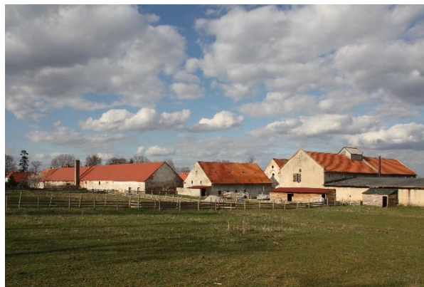
Ilustracja nr 18 Zawiszów, folwark I i II

Zawiszowa i Wilkowa. Układ przestrzenny folwarku, najczęściej będącego elementem zespołu pałacowo lub dworsko-parkowego z folwarkiem, jest z reguły podobny. Zabudowania folwarczne (stodoły, chlewy, spichlerze, wozownie, stajnie itd.) lokalizowano wokół prostokątnego dziedzińca, z trzech stron na planie podkowy. Jeden z krótszych boków dziedzińca był zabudowany pałacem