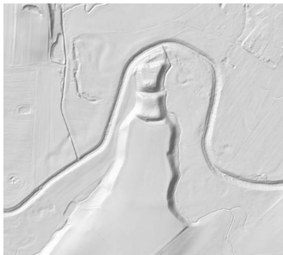
Ilustracja nr 3 Zdjęcie lotnicze oraz wykonane w technologii LIDAR-owej grodziska w Grodziszczu.

wczesnego średniowiecza (V-X w.) na szczególną uwagę zasługuje grodzisko położone w zakolu rzeki Piławy w Grodziszczu. Najstarszy materiał ceramiczny odnaleziony na jego majdanie datowany jest na IX-X w. Prawdopodobnie grodzisko to jest tożsame z kasztem Gramolin wymienionym w bulli papieża Hadriana IV z 1154/5 r. Nieco późniejsze i słabiej rozpoznane są grodziska w Wilkowie