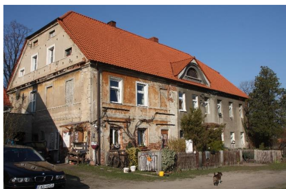
Ilustracja nr 8 Dwór Friedrichshof na ujęciu archiwalnym oraz na fotografii współczesnej