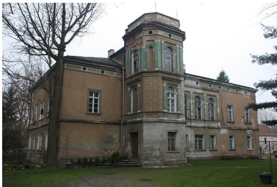
Ilustracja nr 11 Pałac w Wilkowie, widok od wschodu

kondygnacji płytka loggia zaakcentowana pilastrami, pomiędzy którymi trzy otwory okienne zamknięte łukiem pełnym. Dekoracja architektoniczna bogata m.in. w postaci gzymsów międzykondygnacyjnych, rozbudowanego gzymsu koronującego, profilowanych opasek okiennych i drzwiowych. W znakomitej większości zachowała się oryginalna stolarka okienna i drzwiowa.