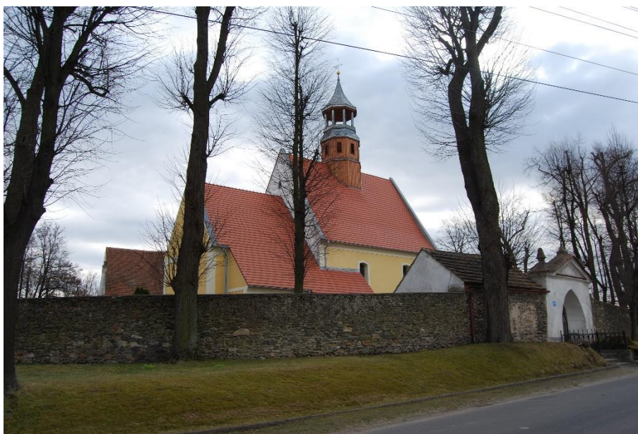
Ilustracja nr 13 Kościół w Grodziszczu, widok od północy

Krzyżowa , kościół filialny pw. św. Michała Archanioła. Pierwsze wzmianki o istnieniu kościoła pochodzą z dokumentów z 1338 r. Obecny wzniesiono w XVI w., po pożarze z 1846 r. odbudowany. Założony na planie prostokąta z nieco węższym i nieznacznie wyższym, zamkniętym prosto prezbiterium, do którego od pñ. przylega założona na planie prostokąta zakrystia. Od zach. wejście poprzedzone kruchtą. Nawa i prezbiterium nakryte dachem dwuspadowym o wspólnej kalenicy w której sygnaturka z ostrosłupowym dachem, zakrystia pulpitowym, kruchta dwuspadowym. Murowany