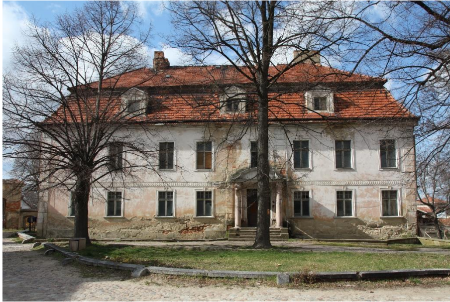
Ilustracja nr 7 Pałac w Komorowie, widok od południa

Komorów , pałac. Obiekt zapewne wzniesiony w XVIII w., przebudowany został ok. 1800 r. Pałac wzniesiony został na planie litery L, dwukondygnacyjny, z wysoką partią piwniczną w szczególności od płn., nakryty dachem mansardowym z połaciach którego lukarny szczytowe. Murowany, otynkowany, z pokryciem dachowym z dachówki ceramicznej karpiówki w kolorze ceglonym układanej podwójnie w koronkę. Elewacja płd. (frontowa) 8-osiowa, z wejściem w osi 5. Przed wejściem portyk kolumnowy wsparty na pilastrach i kolumnach w porządku tokańskim, zwieńczony frontonem w kształcie łuku nadwieszonym pobitym blachą. Dekoracja architektoniczna w formie boniowanych lizen wzmocniających narożniki oraz podkreślających oś 5 w elewacji frontowej, gzymsów międzykondygnacyjnego z motywem cekinowym oraz wydatnego profilowanego gzymsu koronującego, profilowanych obramień otworów okiennych. Stolarka okienna historyczna pochodząca z dwóch faz.