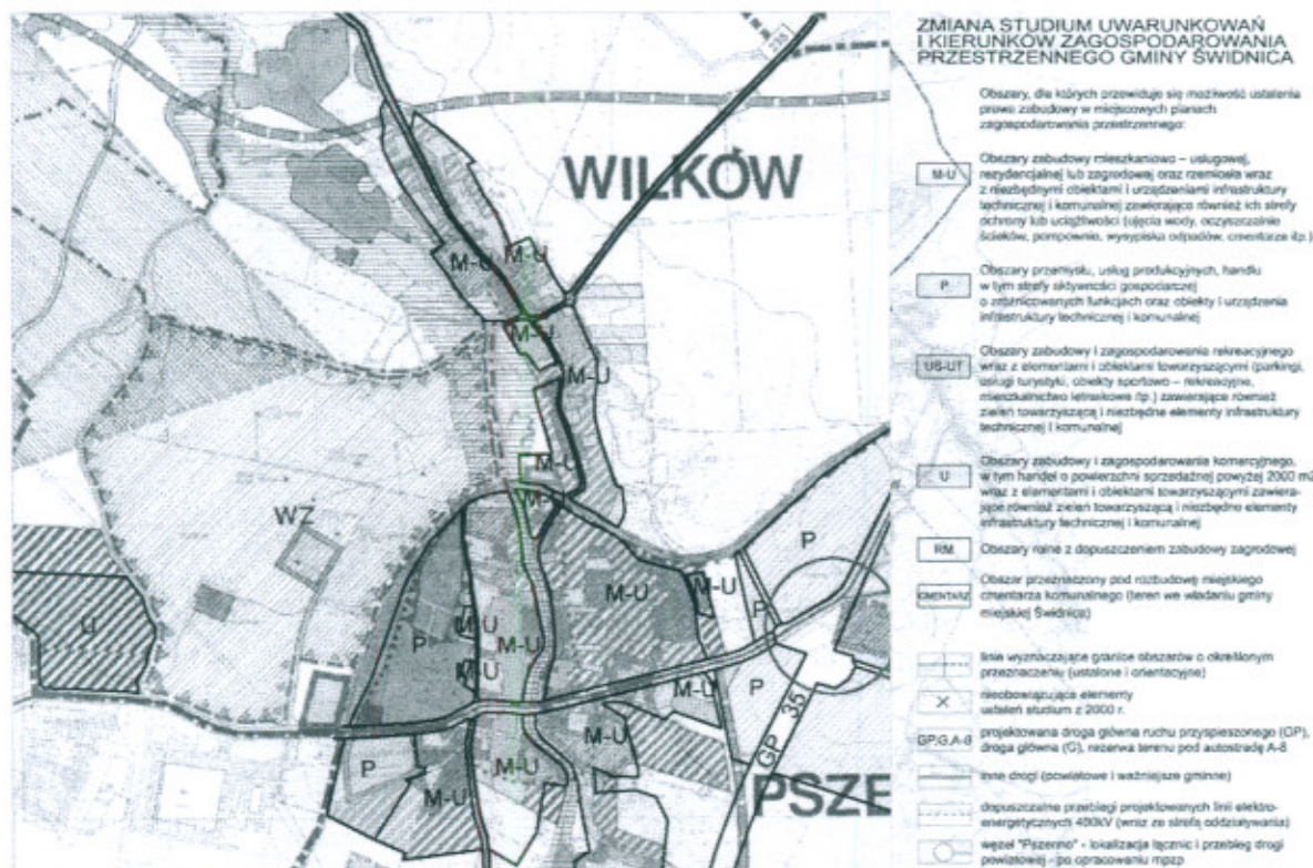
Rysunek 3. Wyrys z aktualizowanego studium uwarunkowań i kierunków zagospodarowania Gminy.