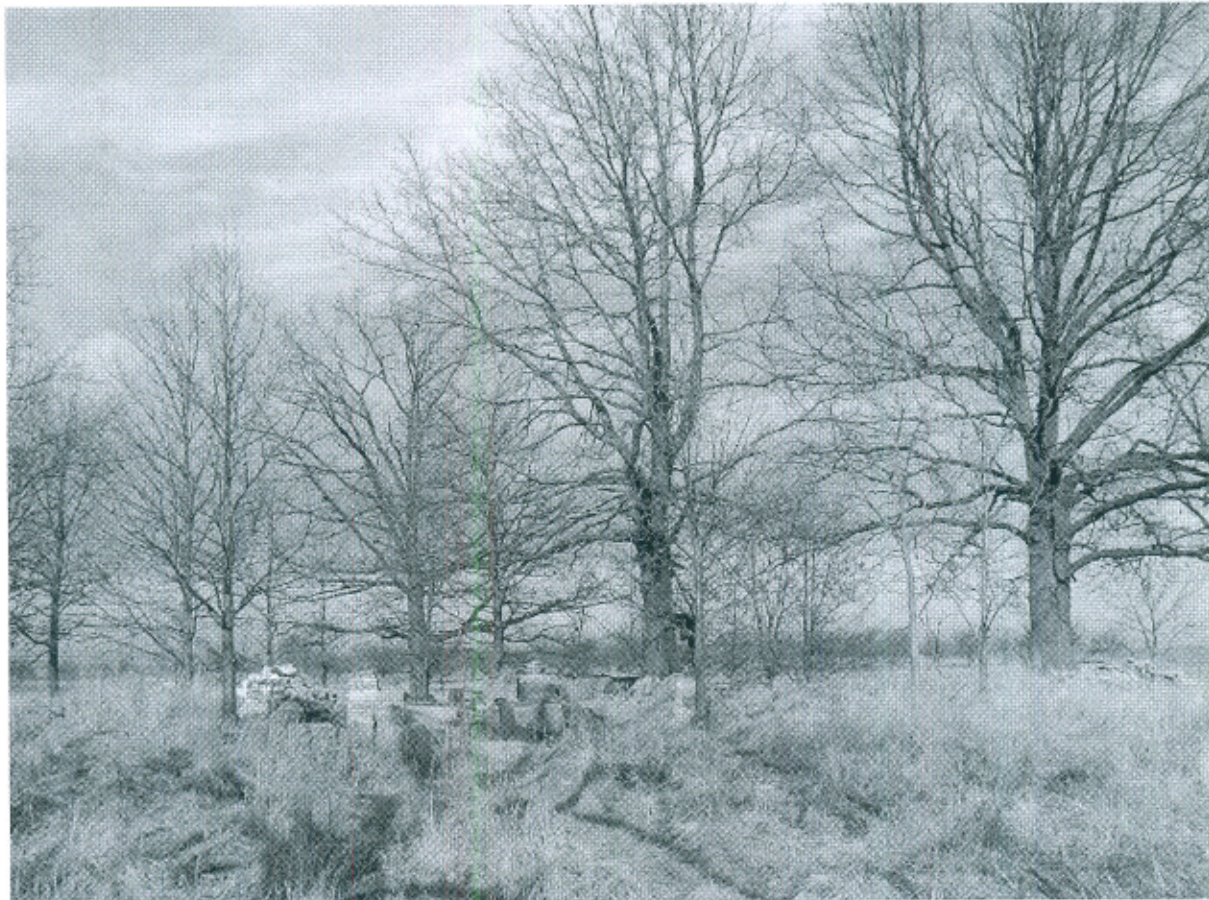
Fot.2. Nieczynny cmentarz ewangelicki