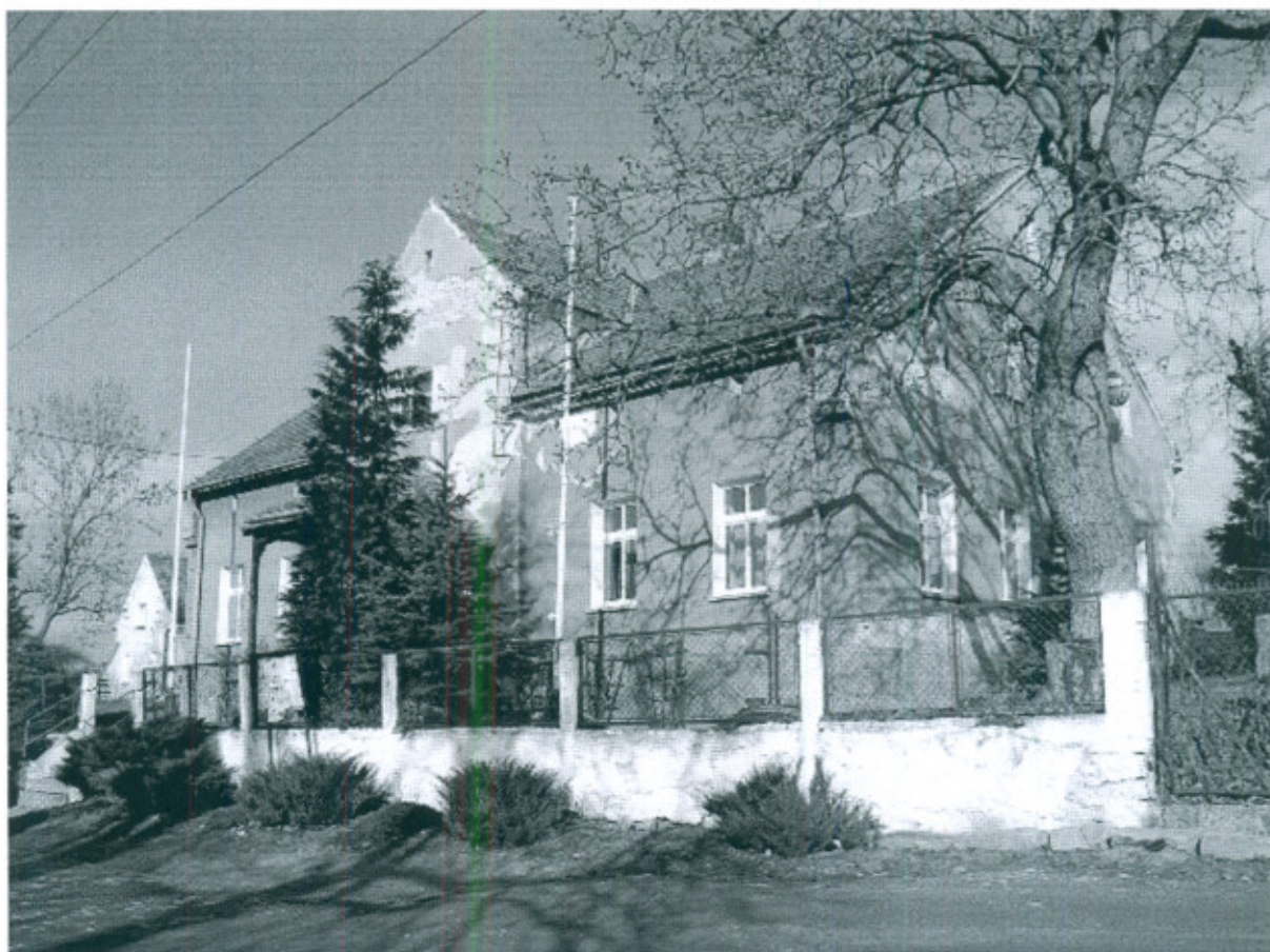
Fot.4. Budynek świetlicy wiejskiej w Wilkowie

Budynek świetlicy jest mocno zdekapitalizowany. Z uwagi na stan techniczny między innymi poszycia dachowego oraz elewacji wymaga niezwłocznego przeprowadzenia niezbędnych prac remontowych.