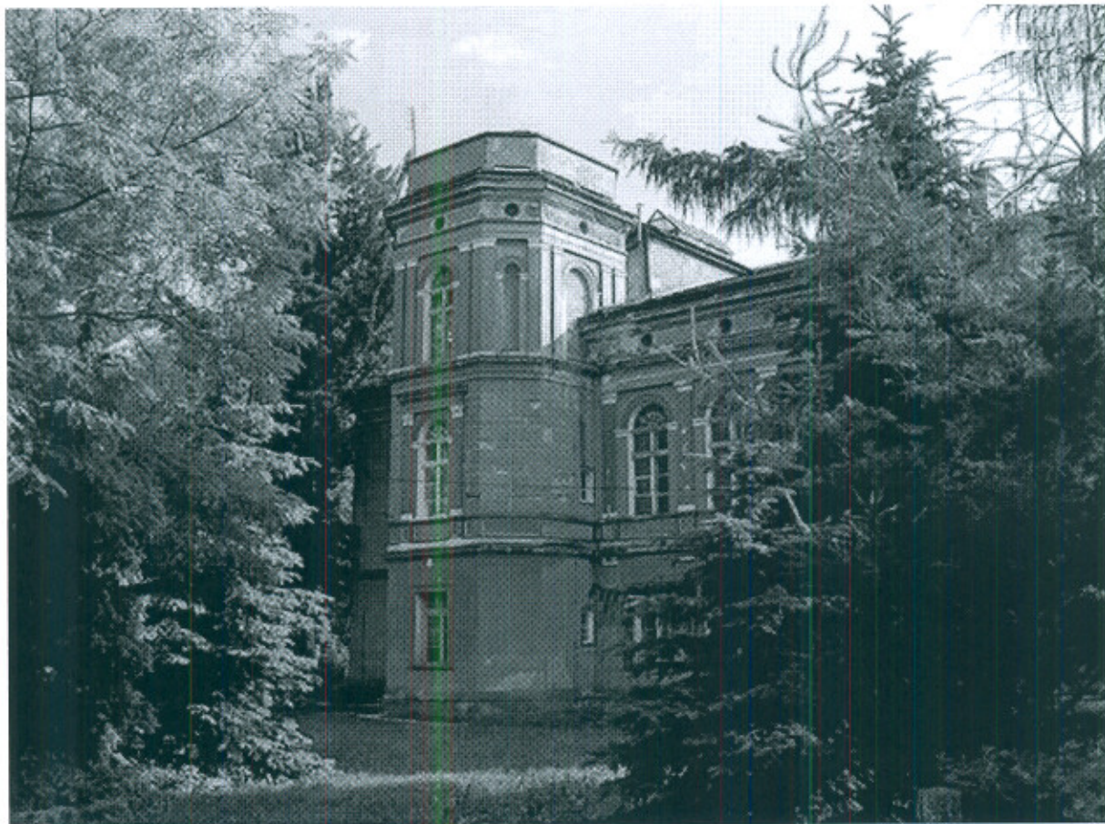
Fot.1. Pałac w Wilkowie (źródło http://dolnyslask.org )

W zabudowie wsi wyróżniają się duże kmiece zagrody części południowej, części północnej, bliżej Niegoszowa, występują nieco mniejsze układy zagród.