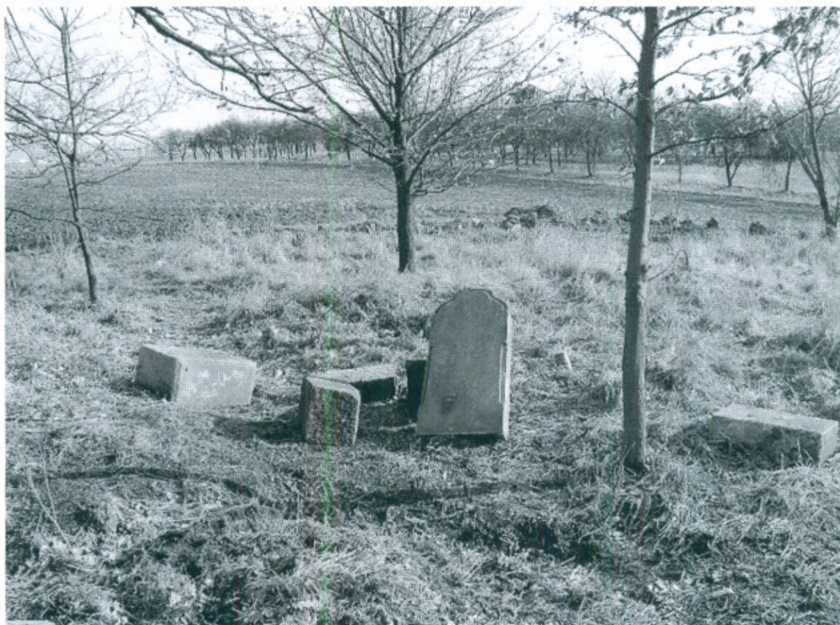
Fot.3. Elementy nagrobków na cmentarzu ewangelickim