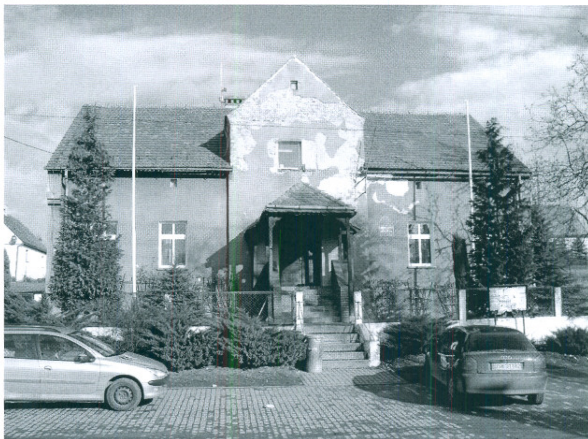
Fot.4. Świetlica wiejska w Wilkowie (wejście do budynku)