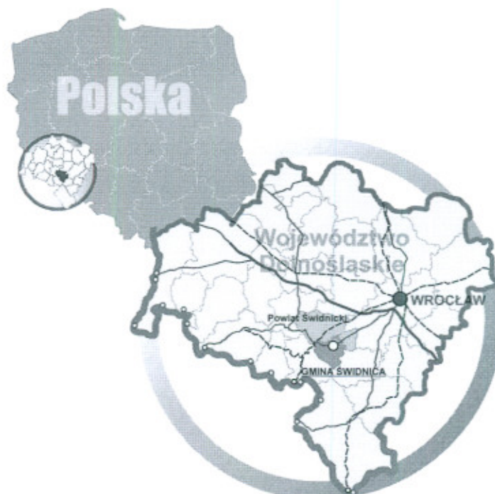
Rysunek 1. Położenie Gm. Świdnica.

Gmina Świdnica to gmina typowo wiejska zamieszkiwana przez 15 640 osób (wg stanu na dzień 31.12.2008 r.). Na jej terenie znajdują się 33 sołectwa, w tym 31 obrębów geodezyjnych i 2 przysiółki. Gmina Świdnica położona jest w południowo – zachodniej części województwa Dolnośląskiego, wokół 60 tysięcznego miasta Świdnica. Od wschodu graniczy z gminą Marcinowice i Dzierżoniów, od południa z miastem Pieszycy i gminą Walim, od zachodu z miastem Wałbrzych i Świebodzice, od północy z gminą Jaworzyna Śląska i Żarów. Najbliżej położone granice gminy Świdnica oddalone są od centrum Wrocławia o około 50 km, Wałbrzycha 20 km, oraz granicy Państwa (przejście graniczne w Golińsku) o około 45 km.