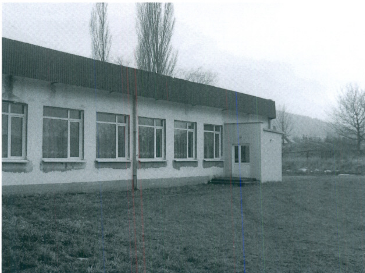
Fot. 7. Świetlica w Lutomi Górnej, widok na salę główną