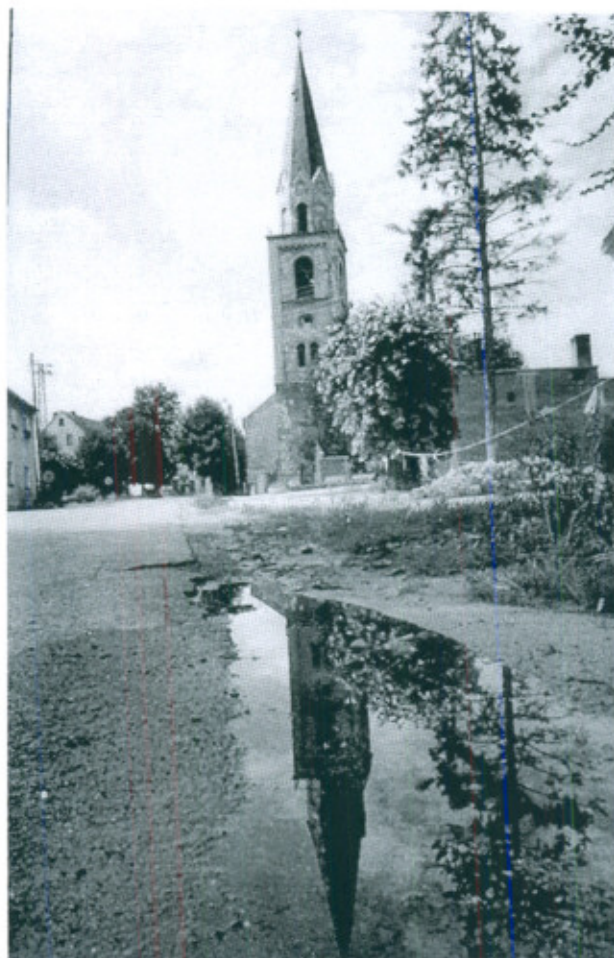
Fot. 4. Wieża kościoła ewangelickiego (zdjęcie sprzed pożaru)