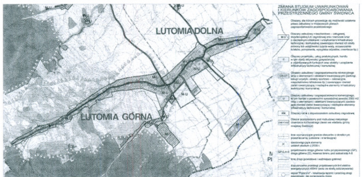
Rysunek 3. Wyrzys z aktualizowanego studium uwarunkowań i kierunków zagospodarowania Gminy.