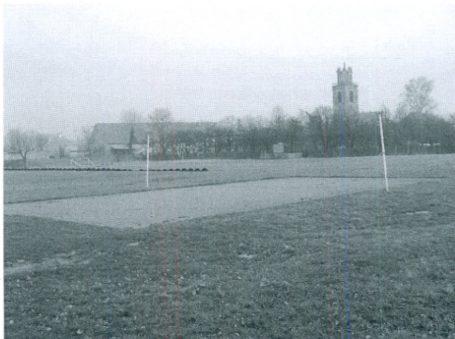
Fot.2. Boisko sportowe w Lutomi Górnej

W miejscowości Lutomia Górna (na styku obrębu z Lutomią Dolną) zlokalizowane jest boisko sportowe o nawierzchni trawiastej. Na obiekcie prowadzone są rozgrywki piłki nożnej seniorów klasy „B” oraz juniorów zespołu sportowego, który ma siedzibę w Lutomi Dolnej. Jest to także teren rekreacyjny dla wszystkich mieszkańców, którzy preferują aktywne formy spędzania wolnego czasu. W Lutomi Górnej działa IV-ligowa sekcja tenisa stołowego, a jej rozgrywki odbywają się w budynku świetlicy wiejskiej.