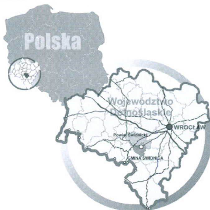
Rysunek 1. Położenie Gm. Świdnica.

Gmina Świdnica to gmina typowo wiejska zamieszkiwana przez 15 640 osób (wg stanu na dzień 31.12.2008 r.). Na jej terenie znajdują się 33 sołectwa, w tym 31 obrębów geodezyjnych i 2 przysiółki. Gmina Świdnica położona jest w południowo – zachodniej części województwa Dolnośląskiego, wokół 60 tysięcznego miasta Świdnica. Od wschodu graniczy z gminą Marcinowice i Dzierżoniów, od południa z miastem Pieszycy i gminą Walim, od zachodu z miastem Wałbrzych i Świebodzice, od północy z gminą Jaworzyna Śląska i Żarów. Najbliżej położone granice gminy Świdnica oddalone są od centrum Wrocławia o około 50 km, Wałbrzycha 20 km, oraz granicy Państwa (przejście graniczne w Golińsku) o około 45 km.