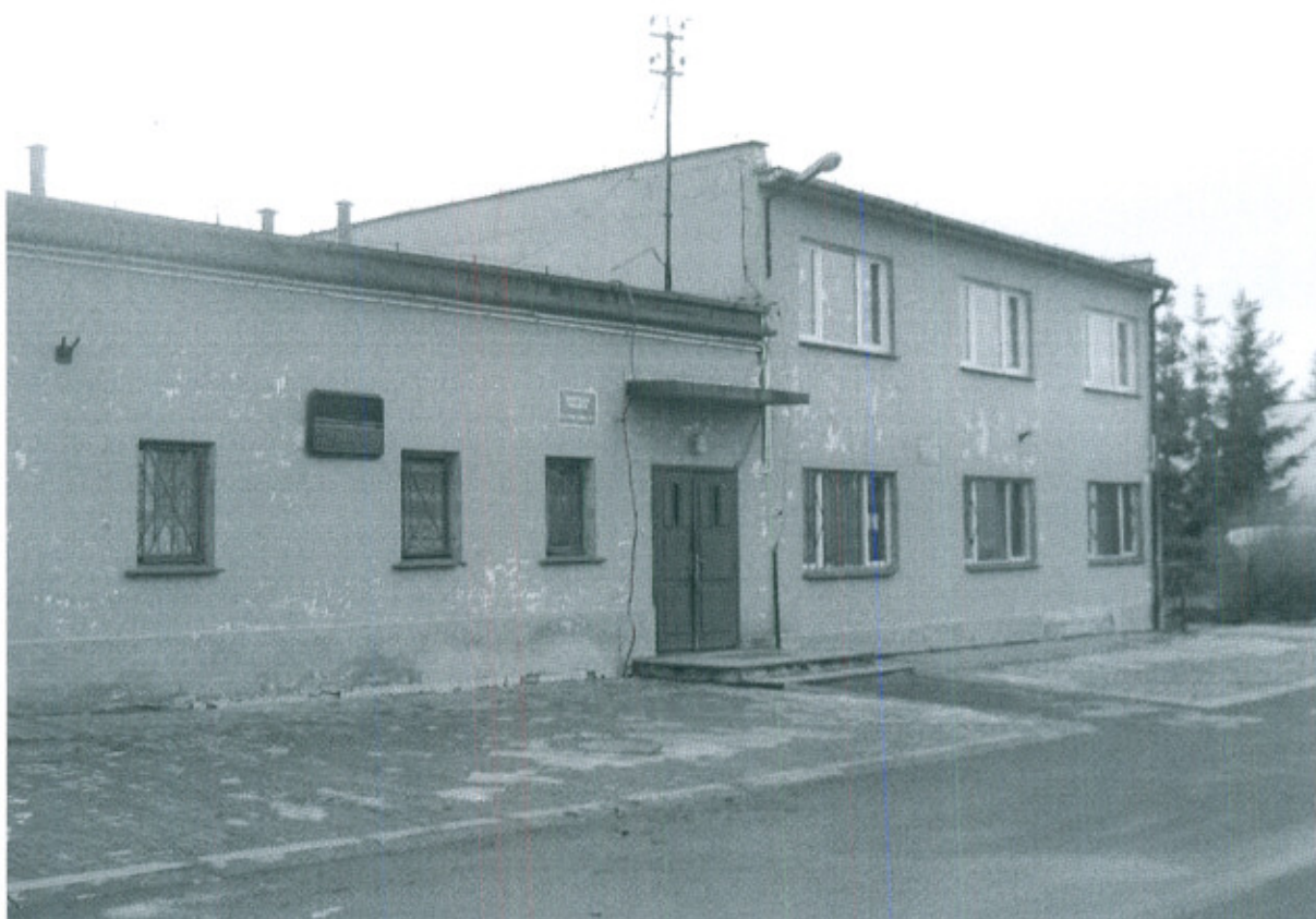
Fot. 6. Świetlica w Lutomi Górnej ściana frontowa, wejście główne

Budynek świetlicy powstał w latach siedemdziesiątych i jest mocno zdekapitalizowany. Z uwagi na jego stan techniczny wymaga niezwłocznego przeprowadzenia niezbędnych prac remontowych.