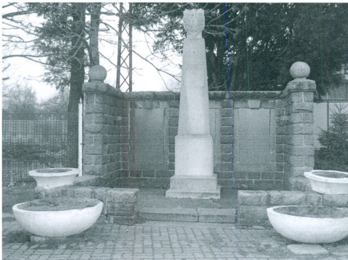
Fot. 5. Pomnik w Lutomi Górnej