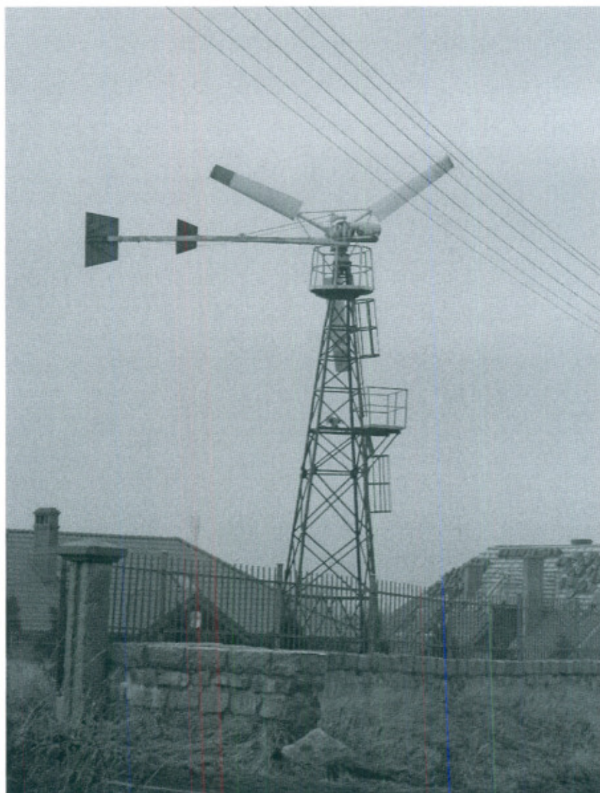
Fot.3. Wiatrak w Lutomi Górnej, własność prywatna

jesieni często występuję zjawisko fenów. Wiatry te podnoszą temperaturę jesienią i w okresie przedzimia. Zjawisko fenów powoduje zanik chmur, częste skoki ciśnienia i porywistość wiatru. Ponadto klimat charakteryzuje duża liczba dni słonecznych, mały opad atmosferyczny z łagodnymi zimami, powoduje to, że lokalne warunki klimatyczne oceniane są jak łagodne, ciepłe i umiarkowanie wilgotne sprzyjające rolnictwu.