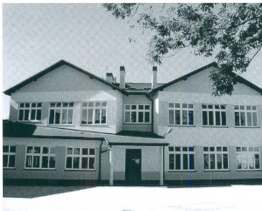
Fot.1. Szkoła Podstawowa w Lutomi Dolnej.

W szkole podstawowej uczy się 207 uczniów w 12 oddziałach. Kadra nauczycielska składa się z 27 nauczycieli. Przy szkole funkcjonują dwa oddziały przedszkolne, w których uczy się 30 dzieci. Do szkoły podstawowej uczęszczają uczniowie z Lutomi Dolnej, Lutomi Górnej, Lutomi Małej, Stachowic, Stachowiczek, Bojanic, Makowic i Opoczki. W szkole zlokalizowane jest multimedialne centrum biblioteczne.